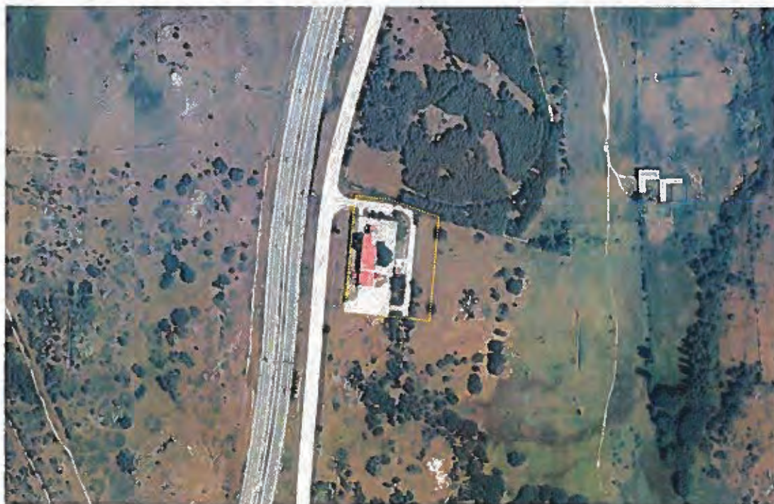
Límite del Plan Especial.

La superficie del ámbito es coincidente con la reflejada en la autorización del Área de Conservación de Montes de 21/01/2020 para la ocupación temporal de los terrenos afectados, con destino al Matadero Frigorífico Municipal de Vacuno, pertenecientes al Monte de Utilidad Pública nº 138, Dehesa de Caramaría.