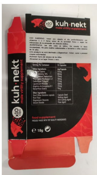
Fig.1 y 2: Imágenes del producto KUH.NEKT CÁPSULAS